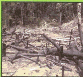
Deforestation destroys habitats