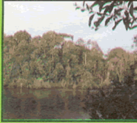
بہت سے جانور یہاں رہتے ہیں

جنگلات کی کٹائی: جب جنگلات کو کھیت، عمارتیں اور سڑکیں بنانے کے لئے کاٹا جاتا ہے۔