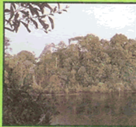
Many animals live here