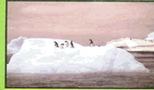
Penguins live on an Iceberg

A habitat is a place needed to hunt, gather food, find a mate and raise a family. If ones habitat is destroyed, it becomes difficult to survive. This goes for animals and human beings alike. Habitats for various animals include wetlands, mangroves, forests, grasslands, oceans, rivers, plains, mountains, glaciers and even deserts.