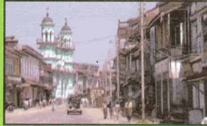
شہروں کی آباد کاری

مسکن کو تباہی سے روکنے کیلئے کیا کیا جاسکتا ہے؟