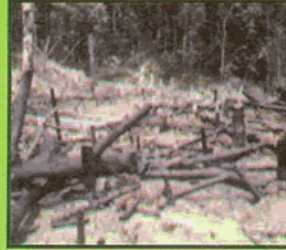
جنگلات کی کٹائی مسکن کی تباہی ہے